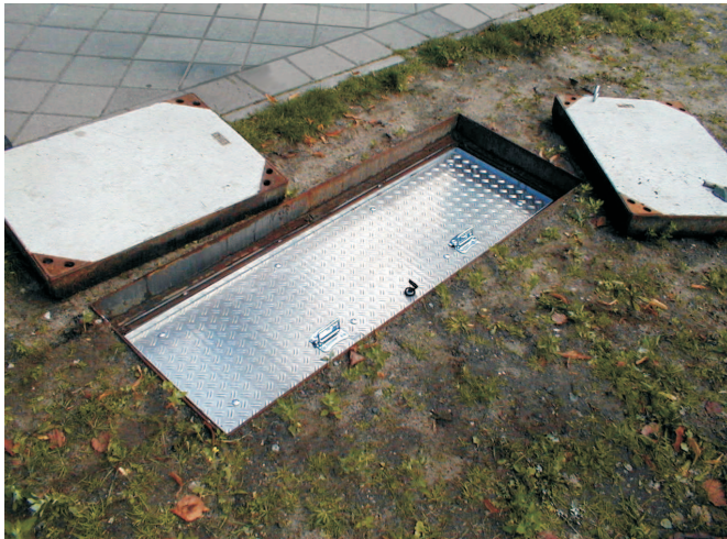
WASI-ALU mit zwei Aushebegriffen (Bild: P-IV 160/50 cm i.L.)

Unter der Schachtabdeckung angeordnet Für alle Schachttypen möglich.